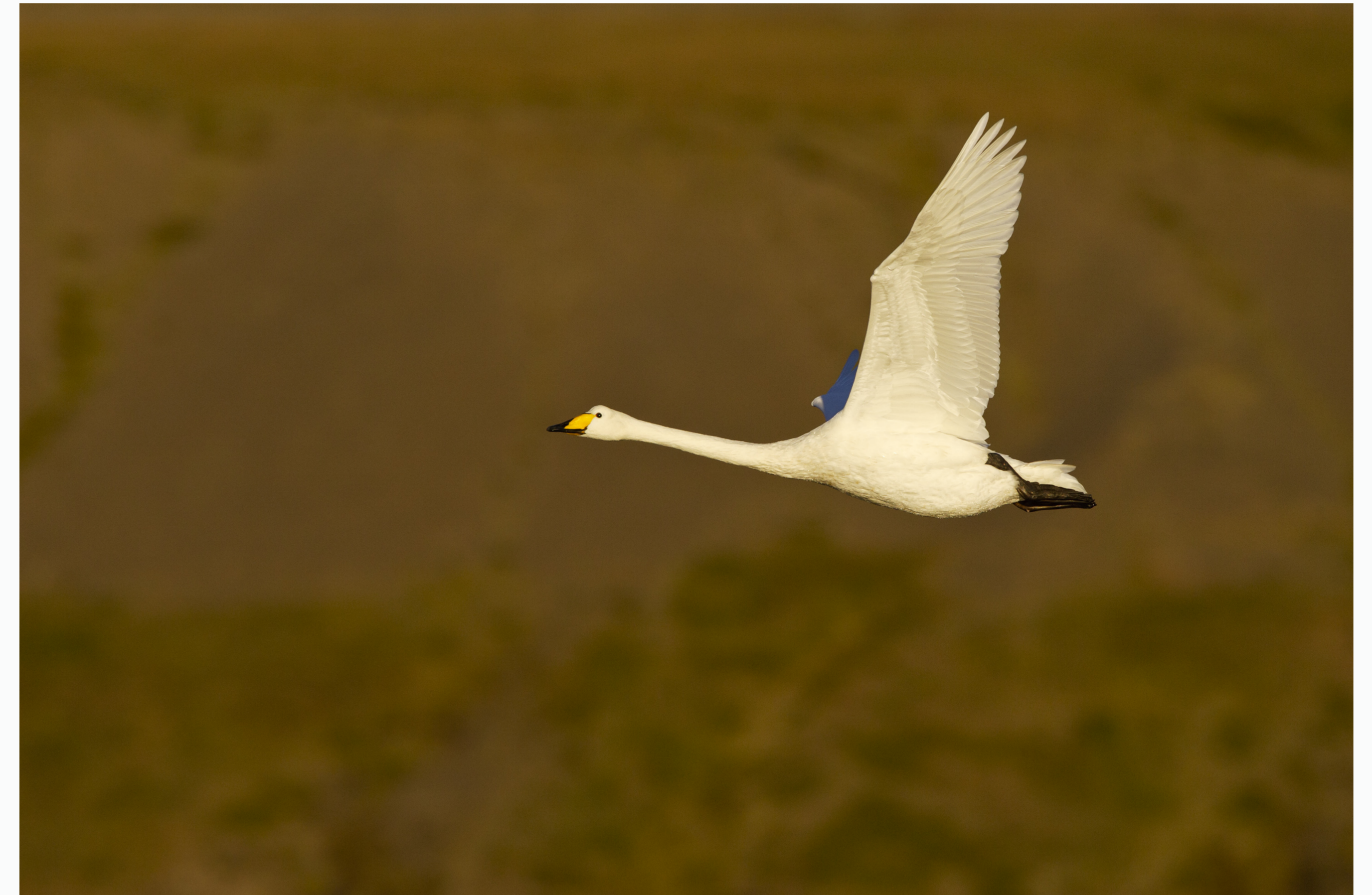
Álft Cygnus cygnus (Daniel Bergmann)