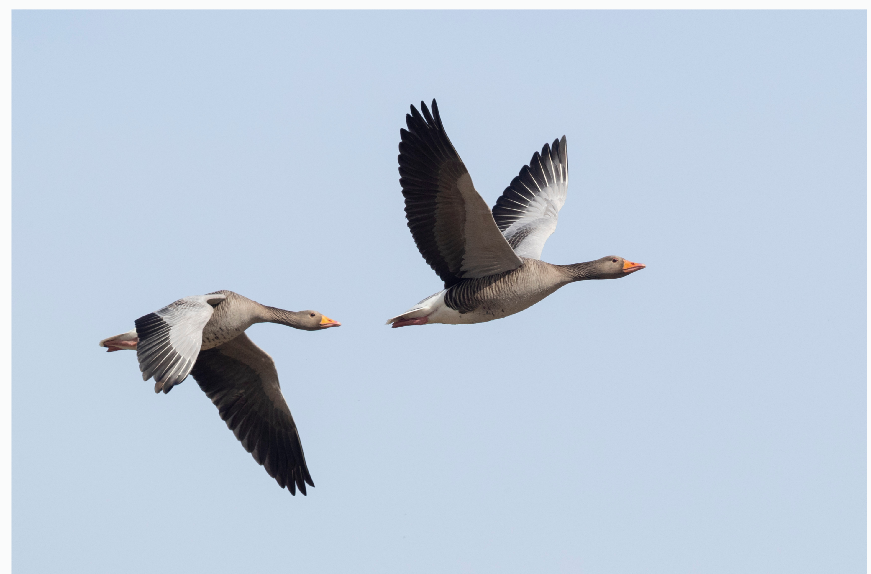
Grágæsir Anser anser (Daniel Bergmann)