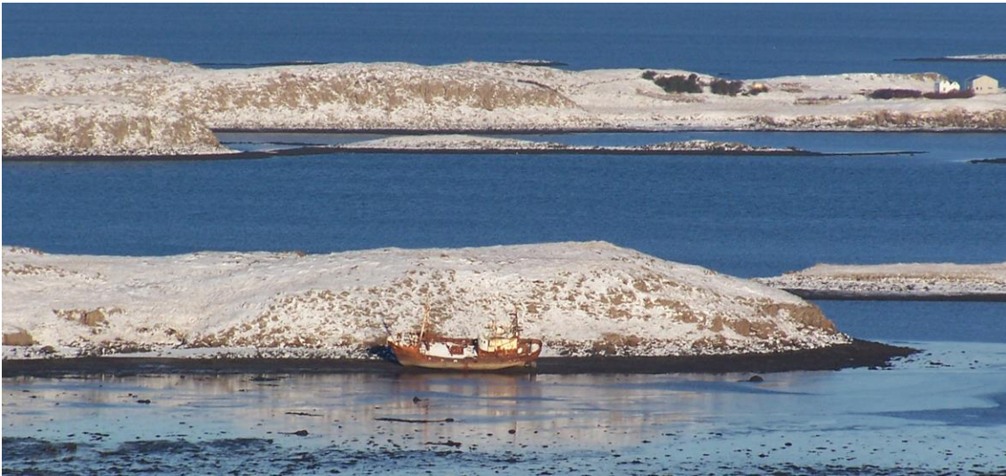
Stálbáturinn Örn í Háey við mynni Hvammsfjarðar. Gvendareyjar í bakgrunni (8. febrúar 2006)